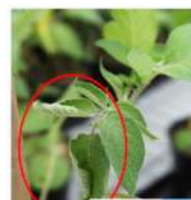
Foto J. Primeros síntomas de la patata causada por Ralstonia pseudosolanacearum.

SINTOMAS Excepto para el estrecho rango de huéspedes del patógeno R. solanaceae , las cepas de RSSC causan marchitez bacteriana en plantas solanáceas cultivadas, como la patata y el tomate, aunque también puede causar marchitez en otros cultivos importantes como el plátano, plátano macho y la yuca. El síntoma inicial en las plantas de patata es la marchitez, aunque éstas inicialmente pueden recuperarse durante la noche. Los síntomas en las plantas de tomate son similares. Con el tiempo, las plantas no se recuperan y mueren. Cuando se examina el tallo, en ocasiones se puede ver una decoloración marrón. Del mismo modo, puede haber exudaciones bacterianas al cortar la superficie del tallo. Este síntoma se observa también en las infecciones del tubérculo de la patata, pudiendo no mostrar síntomas externos. Se dice una plaga regulada como tal en las condiciones siguientes: está presente en el no está muy extendida fuera de ese territorio, o, si ya está presente en el territorio, se está estableciendo en aquellas partes del territorio.