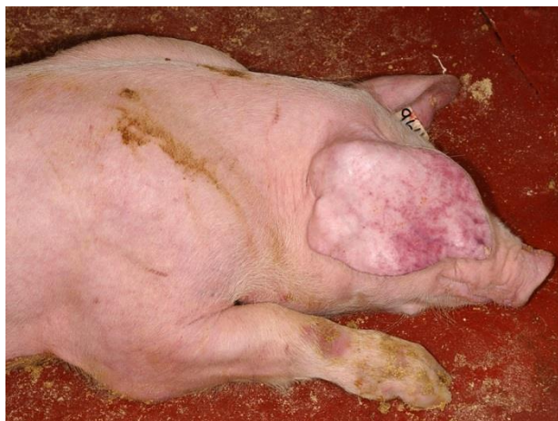
Enrojecimiento das orellas