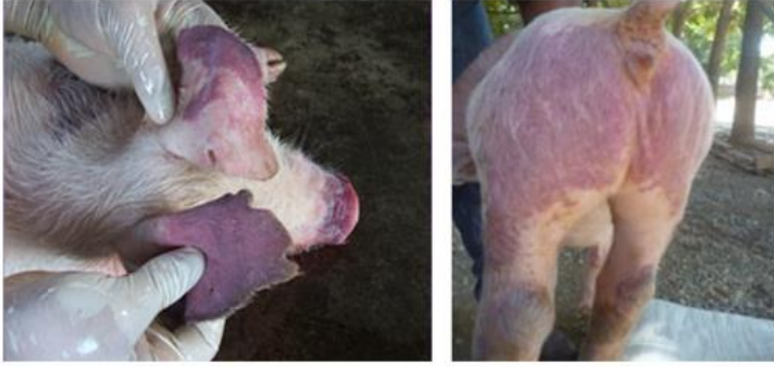
Eritema e pel cianótica (azulada)