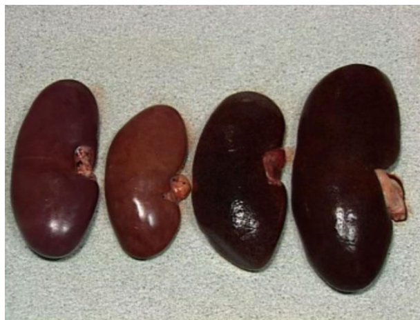
Riles aumentados de tamanho e congestivos (á esquerda)