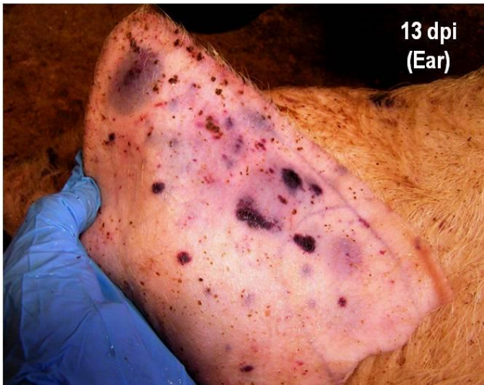
Hematomas e necrose subcutánea en orellas