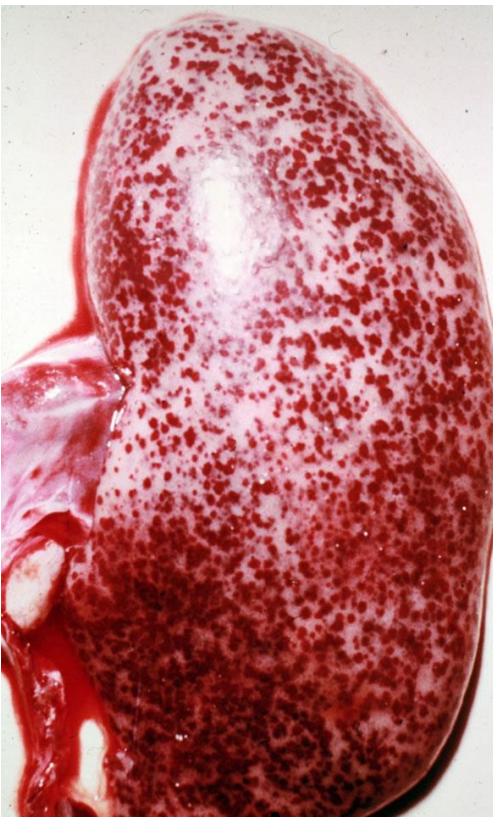
Ril con hemorragias