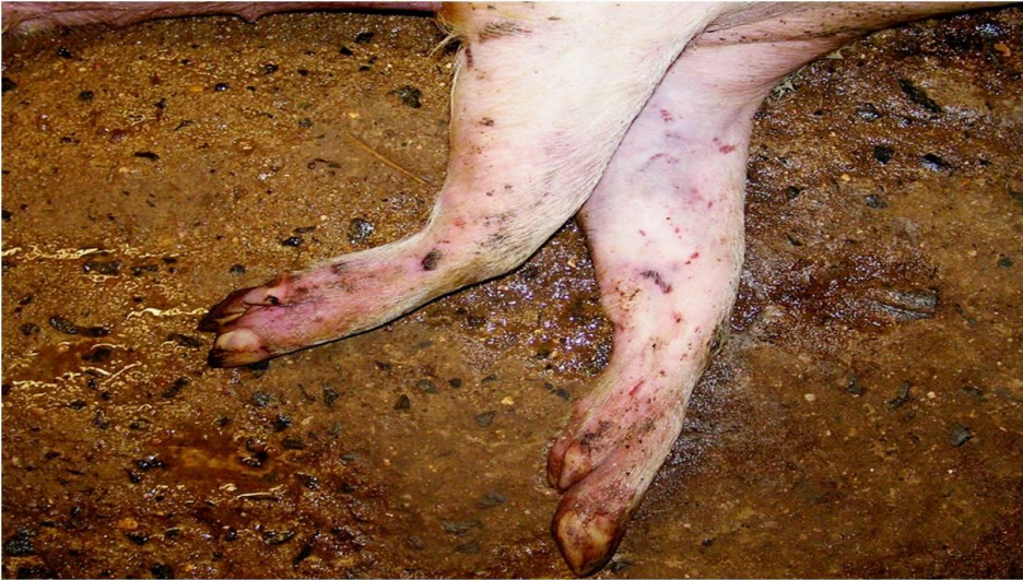
Hematomas subcutáneos en patas