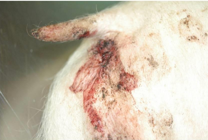
Feces con sangre