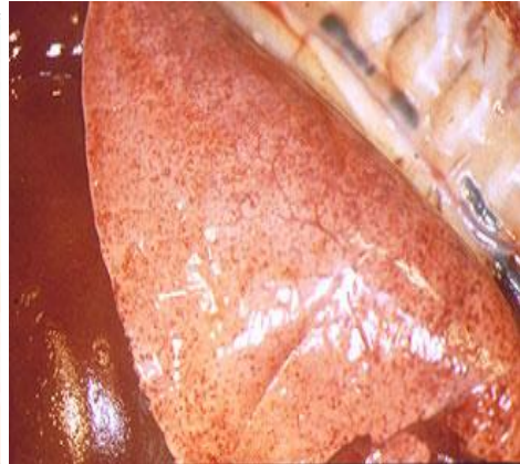
Pulmón con petequias (pequenas hemorragias)