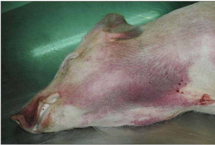
Hematomas e conxestions en zonas baixas corporais